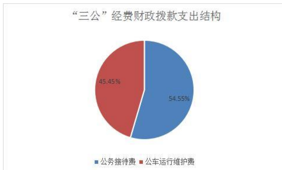
（图 6：“三公”经费财政拨款支出结构）

自流井区自然资源局（本级）2021 年“三公”经费财政拨款预算数 12.5 万元，较 2020 年预算持平，其中：因公出国（境）经费 0 万元，公务接待费 12 万元，公务用车购置及运行维护费 0.5 万元（其中：公务用车购置费 0 万元，公务用车运行费 0.5 万元）。