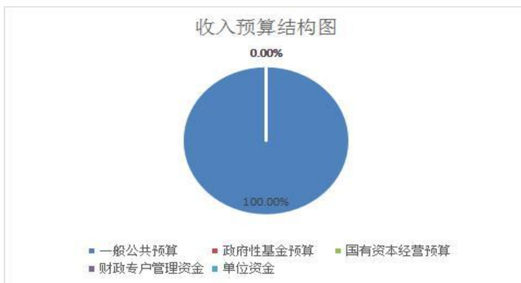
(图 1: 收入预算结构图)