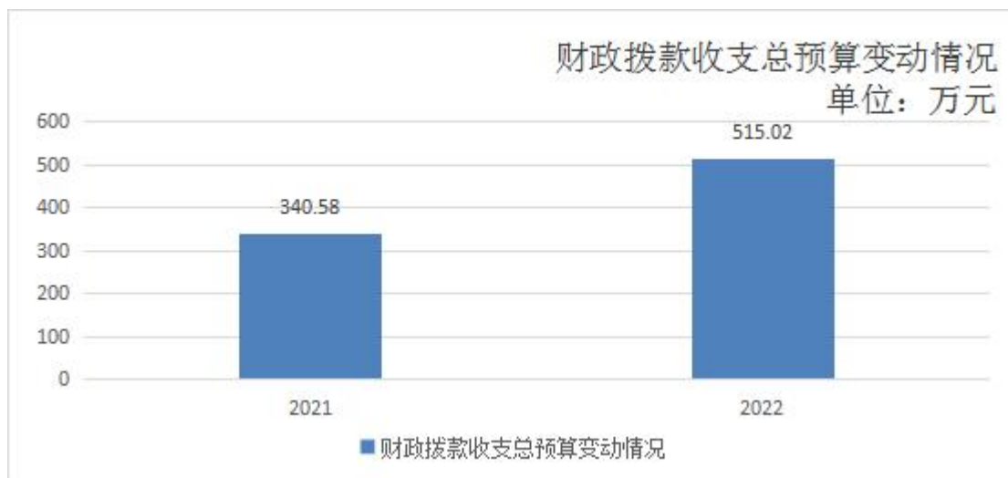
（图 3：财政拨款收支总预算变动情况）

总预算 515.02 万元，比 2020 年财政拨款收支总预算增加 174.44 万元，增长 51.22%，主要原因是 2021 年度项目经费比上年度增加 203.5 万元，该笔项目经费主要用于自流井区范围内松材线虫病防治工作。